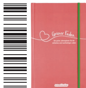
Beere ISBN: 978-3-946658-23-8