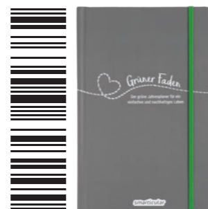
Erde ISBN: 978-3-946658-24-5