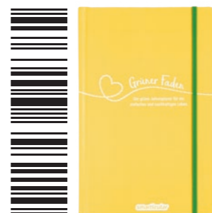
Sonne ISBN: 978-3-946658-21-4