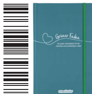
Ozean ISBN: 978-3-946658-20-7