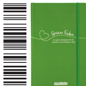
Wald ISBN: 978-3-946658-19-1

Planen, sortieren, ordnen, festhalten – Kalender und Terminplaner gibt es viele. Doch der Grüne Faden ist anders! Ein Lebensplaner voller grüner und kreativer Ideen mit jeder Menge Freiraum für dich.