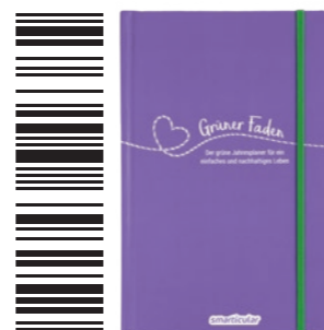
Provence ISBN: 978-3-946658-25-2

smarticular Verlag, 2021 Hardcover, 256 Seiten, 13 × 21 cm Über 120 Illustrationen Original (Hellgrün) ISBN: 978-3-946658-15-3 UVP: € 19,95 (D/AT) gruenerfaden.net